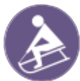
Signalisation der Schlittelwege